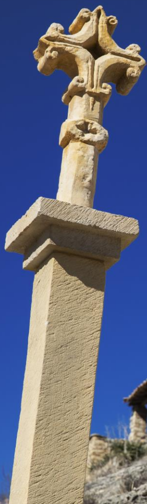
Palanques (Els Ports)

Las visitas se pueden realizar en grupo o de forma individual ya sea en moto, en bici o a pie. Asimismo, por cada etapa superada de la Ruta 99, se ofrecerán diferentes recompensas simbólicas a los visitantes.