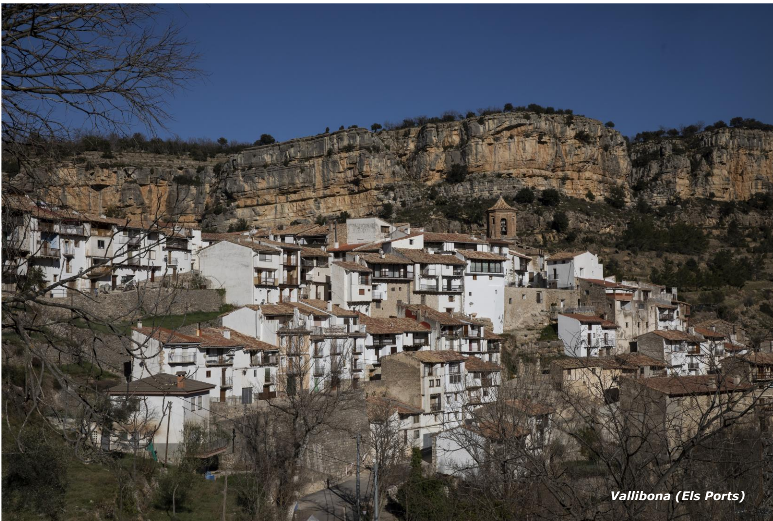
Vallibona (Els Ports)

Próximamente, se desarrollará una segunda fase de este proyecto con el nombre « Ruta 99 Plus », que acogerá otros municipios con más población. Además, se realizarán colaboraciones con establecimientos bajo el nombre « Amigos de la Ruta 99 ».