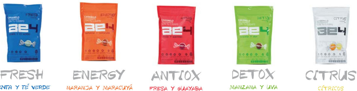
FRESH MENTA Y TÉ VERDE