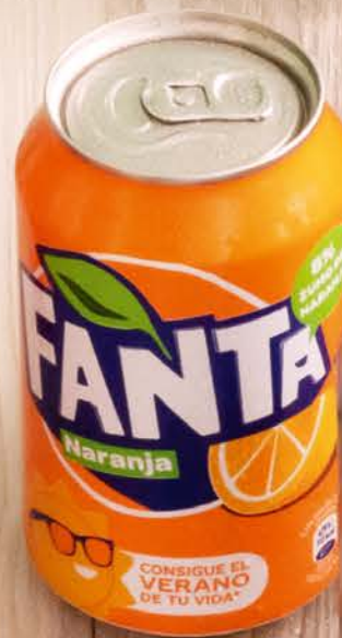
Fanta Naranja Fanta Orange