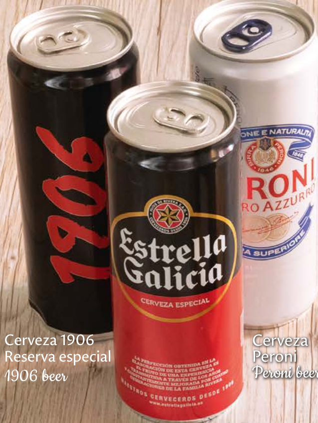
Cerveza 1906 Reserva especial 1906 beer