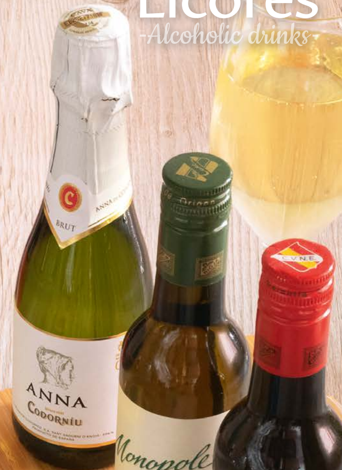
Cava Anna, Codorniu Anna, Codorniu cava