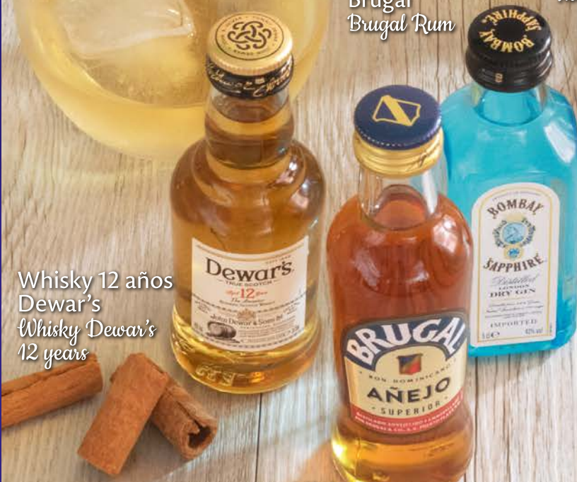
Whisky 12 años Dewar's Whisky Dewar's 12 years