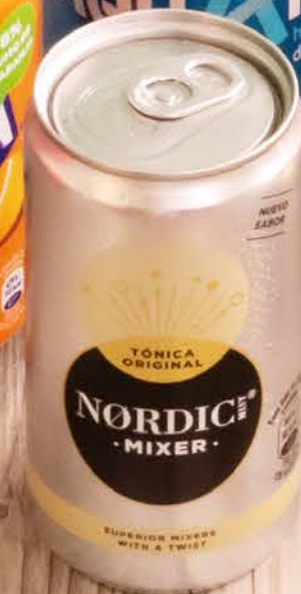
Tónica Nordic Tonic water