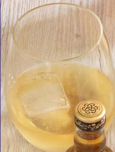
Ron añejo Brugal Brugal Rum