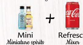
Mini Miniature spirits