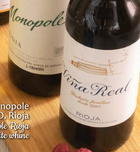
Vino tinto Viña Real D.O. Rioja Viña Real Rioja red wine